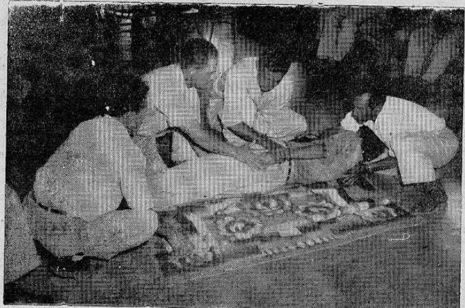
TRABAJADORES EN PRACTICAS DE PRIMEROS AUXILIOS

EVITE LOS ACCIDENTES DE TRABAJO Y NO TENDRA QUE VIAJAR EN AMBULANCIA